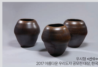
우시형 <산수> 2017 아름다운 우리도자기 공모전 대상, 한국