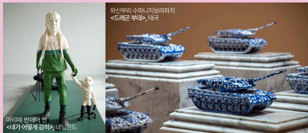
마리페 반테어벤 <네가 어떻게 걸하>, 네덜란드

함께 살아가는 것, '협력'의 의미를 탐구하다! 본전시에서는 사려 깊은 '투게더'의 의미와 중요성을 일깨우는 작품 75점이 전시됩니다. 전시는 1부 세계와 함께, 2부 타자와 함께, 3부 자신과 함께로 구성됩니다.