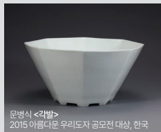
문명식 <각별> 2015 아름다운 우리도자기 공모전 대상, 한국

『제6회 아름다운 우리도자기 공모전』은 한국 도자 예술의 전통을 계승하고 현대적으로 발전시키기 위해 열리는 공모전으로 수상작 40여점이 전시됩니다.